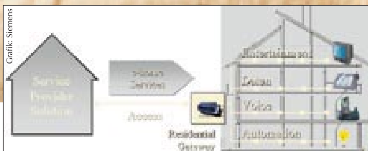
Die wichtigsten Bestandteile des electronic HOMEs: ein vernetztes Haus (Multimedia, Sprache, Daten, Hausautomation als dezentrale, ansteuerbare Systeme) und ein Haus im Netz (Verbindung zu Diensten von Service-Providern über verschiedene Zugangsmedien) und als Kopplung das Residential Gateway.