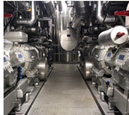
Durch Gebäudeautomation und neue Energiesysteme werden die ETH-Gebäude immer komplexer: die neue Kältezentrale MLY ist ein Beispiel dafür.

Die Abteilung ist das Engineering-Zentrum der ETH Zürich für Gebäudetechniksysteme, Gebäudeautomation, Labortechnik, Energieversorgung, Werkstätten-Technologie und Campusnachhaltigkeit.