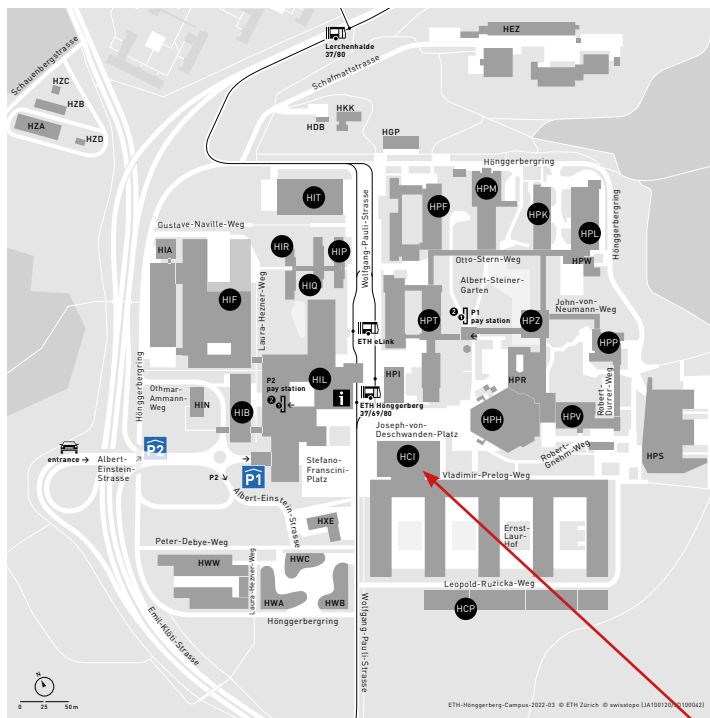
Area plan of the Höggerberg campus

Gebäude HCI ETH Zürich Höggerberg campus Stefano-Francini-Platz 5 8093 Zürich