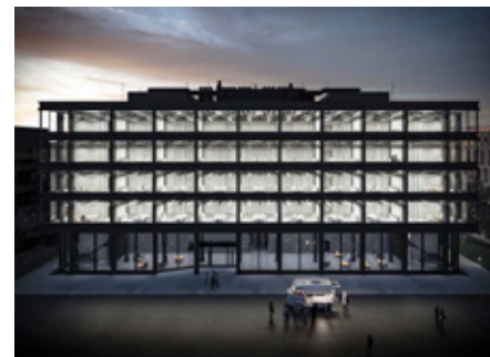
Von 2022 - 2028 soll auf dem Campus Hönggerberg das neue Physikgebäude HPQ gebaut werden.

Wie werden Dinge in digitalen Infrastrukturen miteinander vernetzt?