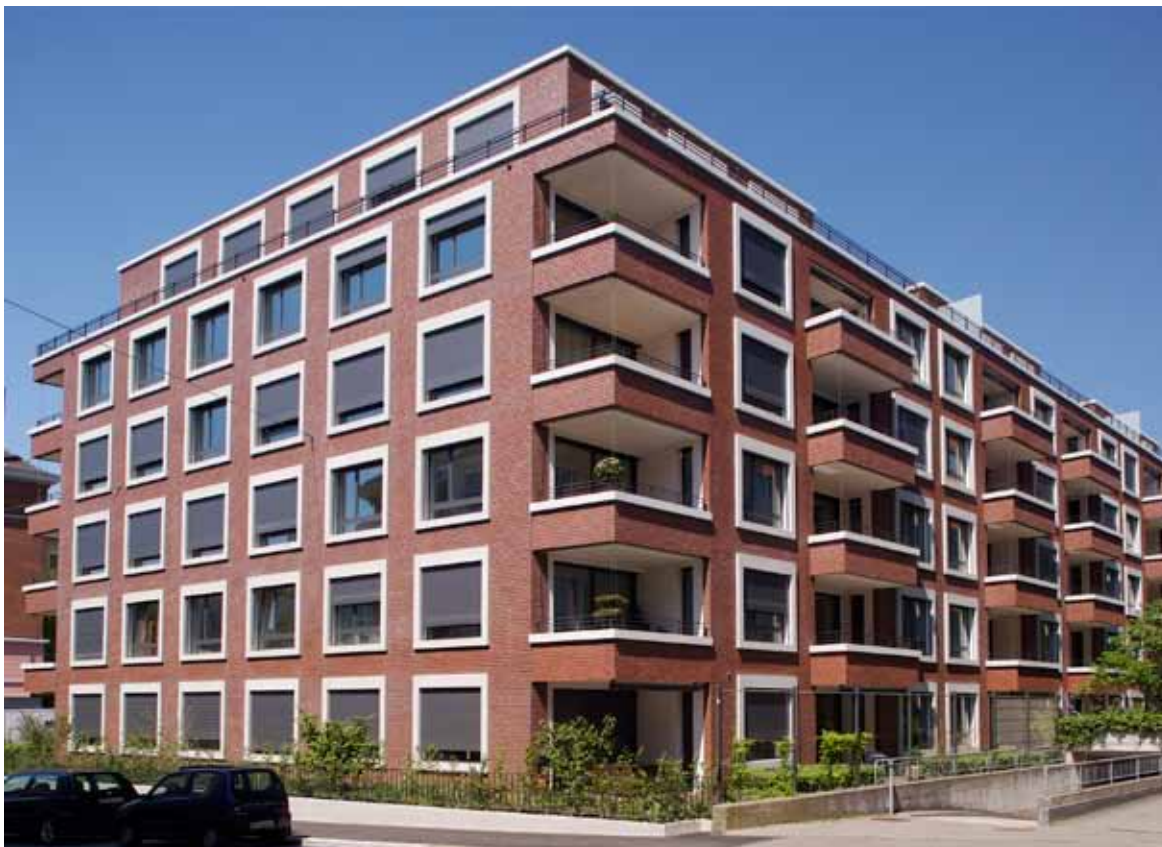
Die Überbauung Wildbachgut in Zürich umfasst 64 Wohnungen mit hohem Ausbaustandard. Fibre to the Home und eine Multimediaverkabelung gehören dazu.

So schön das alles klingt: Das Wildbachgut war auch eine Art Pionierprojekt, das künftige Entscheidungen im Bau von Glasfasernetzen durchaus beeinflusst haben dürfte. So ging es während der Erschliessung vor allem darum, wer denn nun das Glasfasernetz legt bzw. legen darf. Ist es das ewz (Elektrizitätswerk der Stadt Zürich),