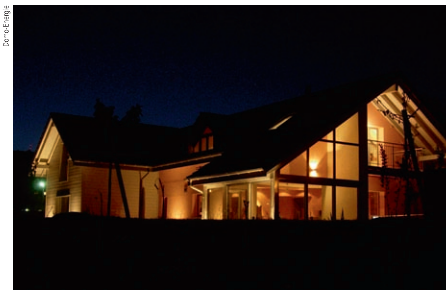
Figure 1 Habitation au standard Minergie équipée du système KNX. La gestion de la protection solaire et des ouvrants est source d'économies d'énergie et de confort.

Les différents événements mondiaux survenus début 2011 nous rappellent l'importance du défi à relever en terme d'économie d'énergie et de limitation de dégagement de gaz à effet de serre. Dans ce contexte, les décisions prises antérieurement par l'Union Européenne pour établir un projet de normalisation sur la conception des bâtiments prennent un