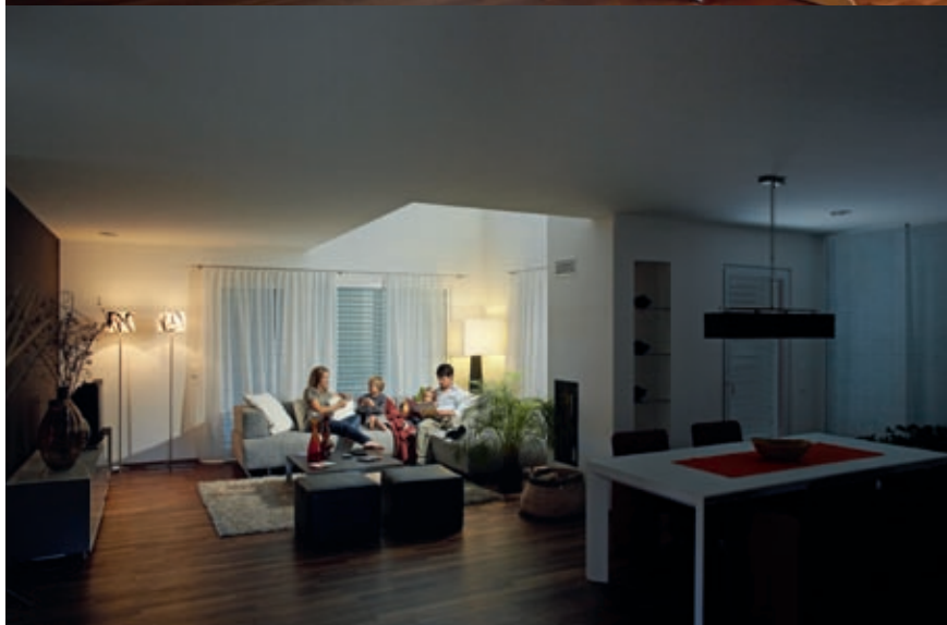
Figure 4 Quand on connaît, on ne s'en passe plus : la mémorisation de scènes d'ambiance d'éclairage programmables et reproductibles à volonté.

mode », soit par le biais d'un appareil portable tel que le configurateur TX 100 de la société Hager.