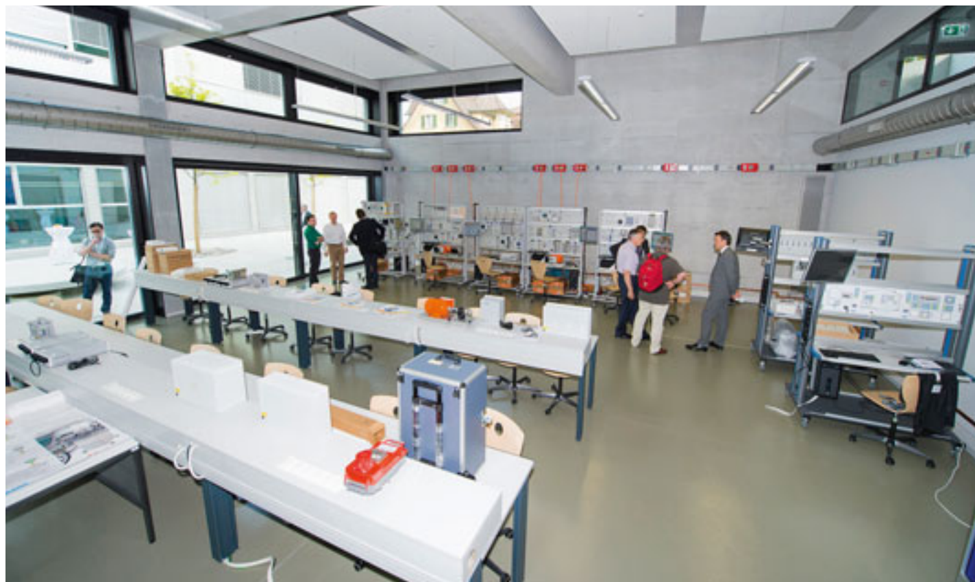
— Das Ausbildungsangebot für die Gebäudeautomation wird stark ausgebaut, zum Beispiel an der ABB-Technikerschule.